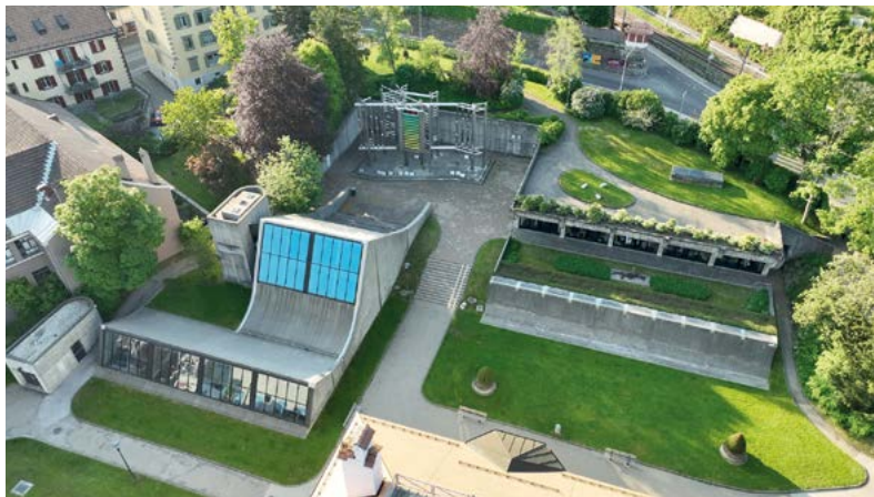
Le MIH au cœur du Parc des musées de La Chaux-de-Fonds