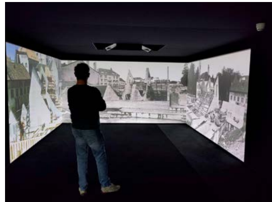
Immersion dans le chantier de construction du MIH

Le MIH est construit entre 1972 et 1974 sous la direction de l'architecte chaux-de-fonnier Georges-J. Haefeli (1934-2010) et du zurichois Pierre Zoelly (1923-2003). Il est financé de manière conjointe par la Ville, le Canton, la Confédération et l'industrie horlogère, sous l'égide de la Fondation Maurice Favre spécialement créée en 1967 dans l'objectif de doter La Chaux-de-Fonds d'un nouveau musée d'horlogerie à la hauteur de l'importance de ses collections. Unanimement salué par la presse à son inauguration, le MIH est lauréat du premier Prix Béton, en 1977. Il reçoit le Prix Cembureau et est promu Musée européen de l'année en 1978. Une projection immersive avec des images d'archives et actuelles relate l'épopée de la construction du Musée. Des témoignages d'architectes de renom, dont le fameux architecte suisse installé à New York Bernard Tschumi, créateur notamment du Musée de l'Acropole à Athènes, mettent en exergue ses caractéristiques constructives et révèlent les anecdotes inédites de l'inauguration il y a 50 ans.