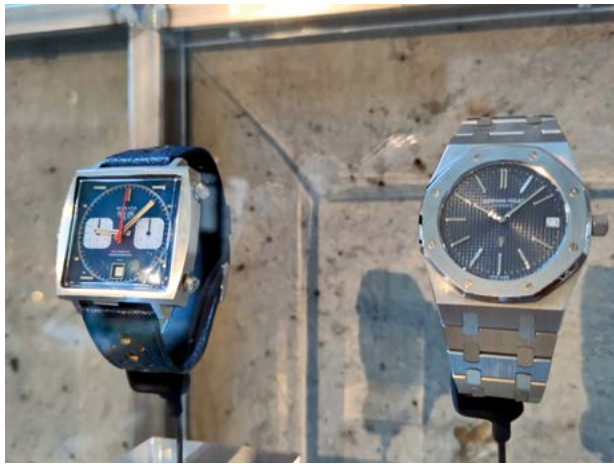
Deux modèles emblématiques des années 1970 : la Monaco de Tag Heuer et la Royal Oak d'Audemars Piguet

À la fin des années 1960, l'industrie horlogère connaît une série de mutations. La production de masse, l'apparition de nouvelles technologies, le libre-échange et les soubresauts de l'économie mondiale bousculent les modes de production et les marchés préétablis. Ces changements donnent lieu à une remise en question des conventions. Durant cette période charnière, les manufactures innovent, créent et imaginent la montre de demain. L'effervescence qui règne engendre une série d'innovations, plus ou moins fructueuses. Certaines nouveautés, à l'image du quartz, des matières plastiques ou encore du digital, présentées en introduction de l'exposition, bâtissent les canons esthétiques et technologiques de l'horlogerie actuelle.